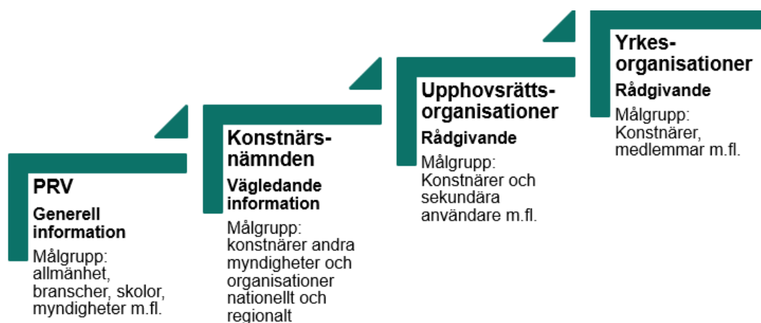
Figur 2. Karta över olika roller inom information, kunskapshöjning, vägledning och rådgivning.

Konstnärsnämnden har praktisk och övergripande kunskap om konstnärers villkor. Myndigheten har i uppdrag att informera i frågor som rör skatte- och trygghetssystemens utveckling i relation till konstnärlig verksamhet.