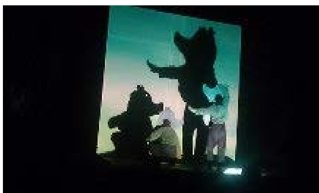
Repetitionsbilder från föreställningen