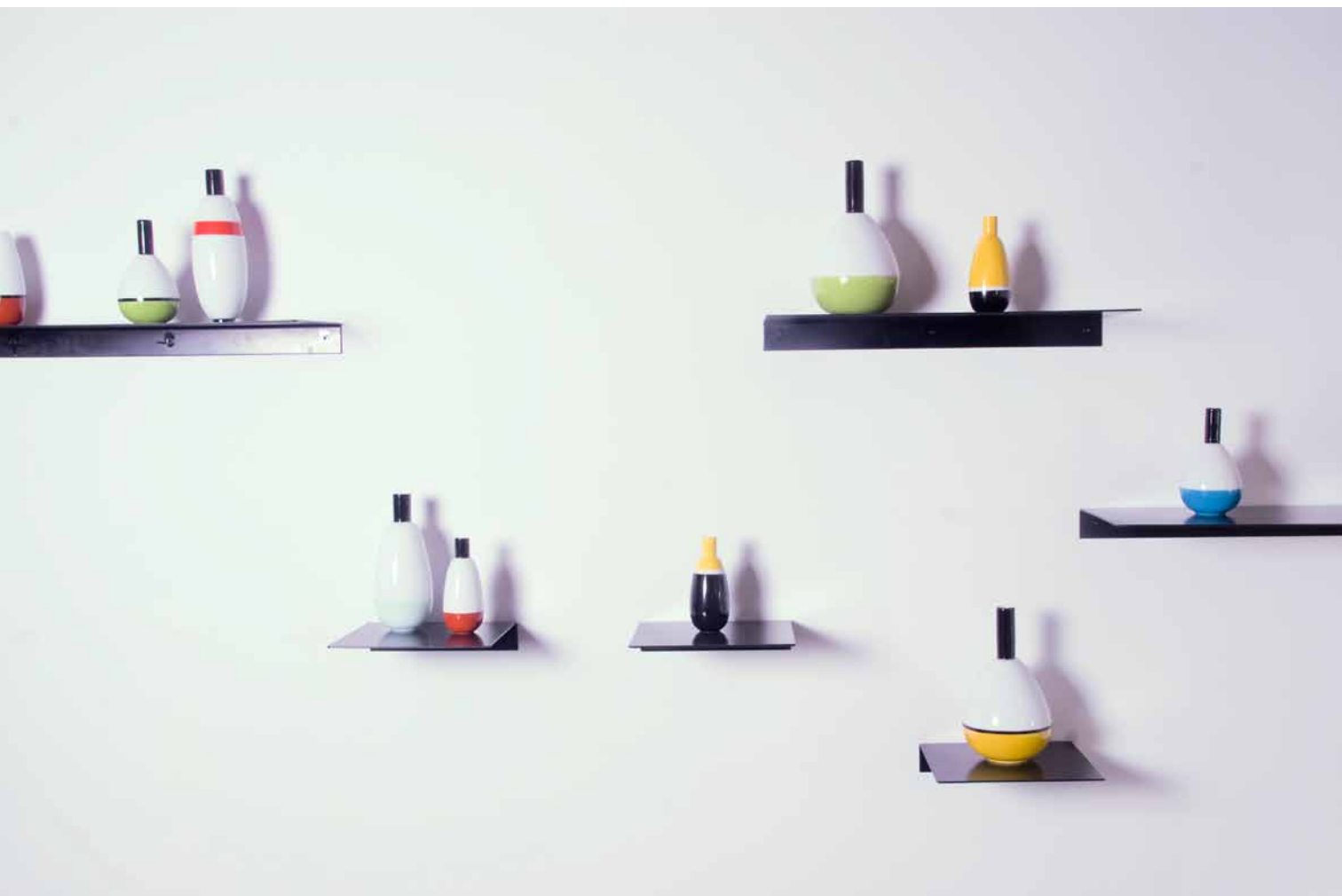
'FLOATING' / INSTALLATION AVVASER I PORSLIN / AGNES FRIES / UBI GALLERY / PEKING