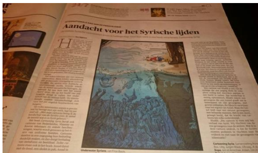
Boekbespreking / book review Cartooning Syria NRC Next

Cartooning Syria in het Vlaamse magazine Knack: