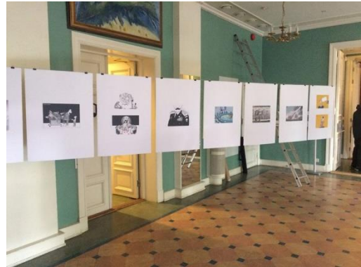
Cartooning Syria in Lillehammer at Norsk Literatur Festival. Kulturhuset Banken.