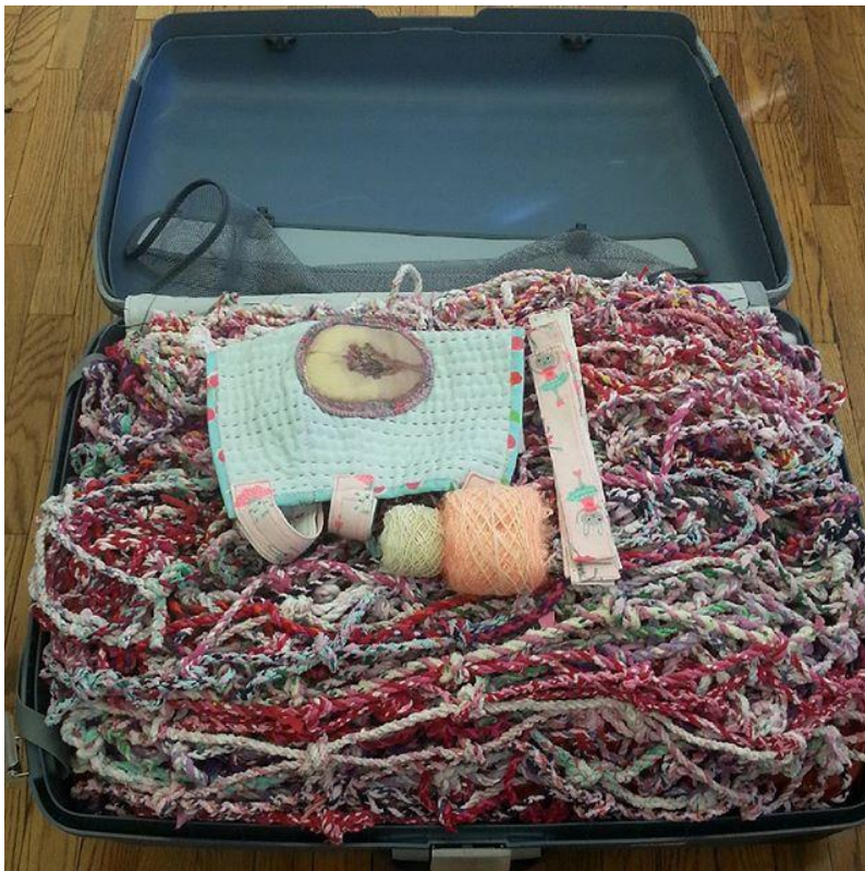
PACKNING NETWORK, QUILTED BABYS; WEAPONS TO CEEP GROWNUPS AWAY, SKYDDSDRÄKT, resväska Penland 2016

Skyddsdräkten är ett fortgående projekt där delar skapas och läggs till vart efter behovet uppstår. Den ska och bör användas med måtta, tanken är inte att fly utan att skapa det utrymme som behövs för att möta och se världen för vad den är. I sommar kommer jag att ikläda mig dräkten och utföra ett performance under titeln: Soma status: Gott. Kortklippt, rödfärgat hår. Välklädd, överviktig, ser något yngre ut än sin kronologiska ålder. Där jag kommer att läsa valda delar av mina journaler från BUPs arkiv. På så vis hoppas jag föra samman dåtid och nutid till en gemensam och dynamisk berättelse.