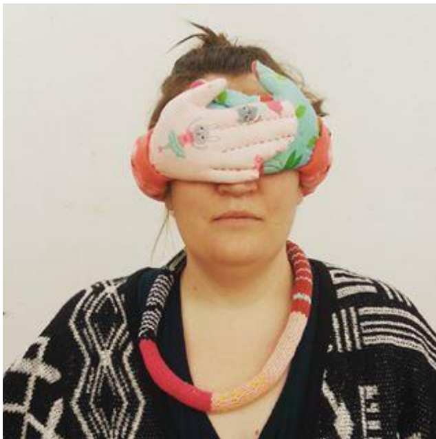
BLINDFOLDED. Samlade bebiskläder, stoppning, resårband. Penland 2016