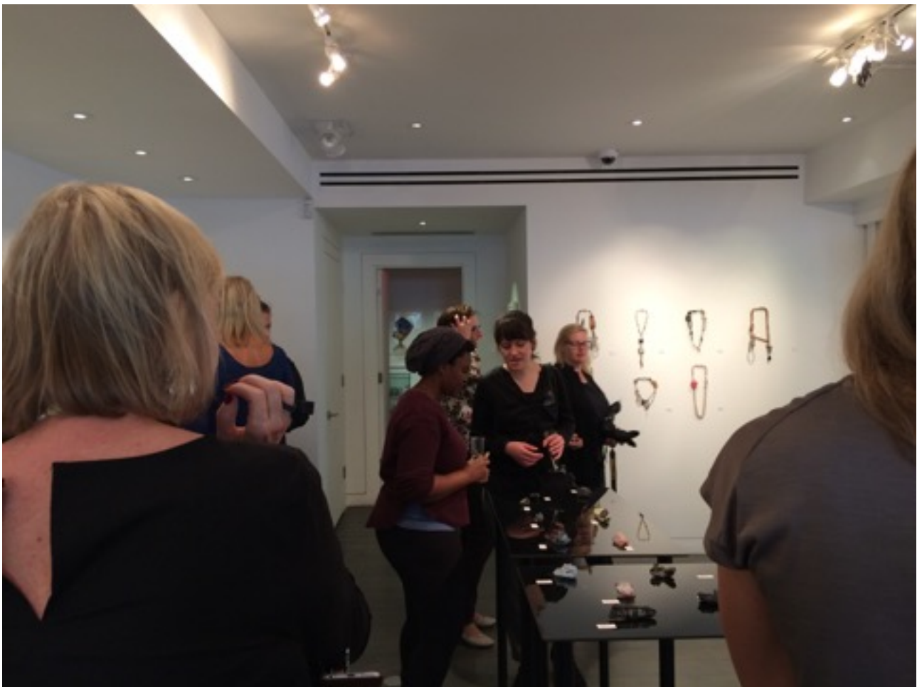
Mina smycken hängande på vägg.

För mig innebar utställningen en nystart och en anledning att ta mig in i arbetet på ett mer sammanhängande vis än jag haft möjlighet till på många år. Det gav mig därför extra stort nöje att även kunna se alla halssmycken samlade på en plats och att själv i viss mån få presentera mitt arbete.